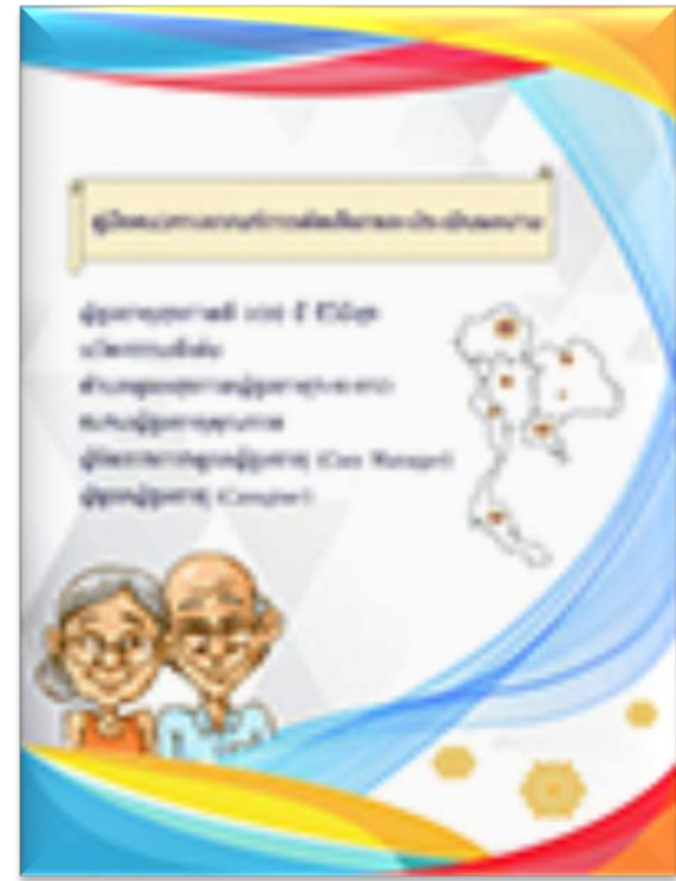
หน้าเว็บ ไฟล์ excel word